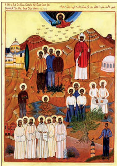
icône des 19 Martyrs d'Algérie

Enfin le 8 décembre, dans l'action de grâce j'ai suivi la cérémonie de béatification des 19 Martyrs d'Algérie.